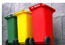
Gestion des déchets