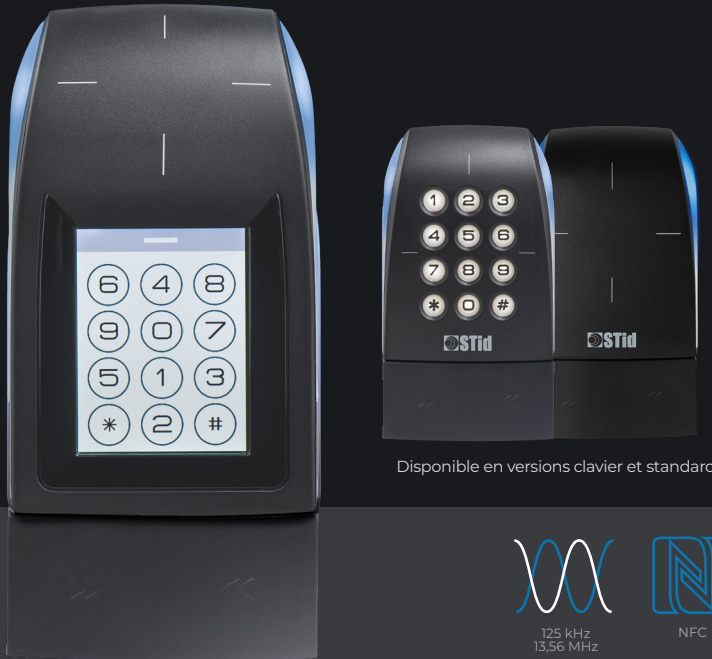
Disponible en versions clavier et standard

125 kHz, MIFARE® DESFIRE® EV2 & EV3, NFC