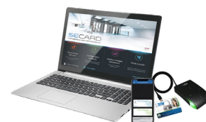
SECARD Kit de programmation SECard et les protocoles SSCP® v1 & v2 et OSDP™

* Nos lecteurs lisent uniquement le numéro de série / UID PICO1444-3B de la puce iCLASS™. Ils ne lisent ni les protections cryptographiques iCLASS™ ni le numéro de série / UID PICO 15693 de HID Global.